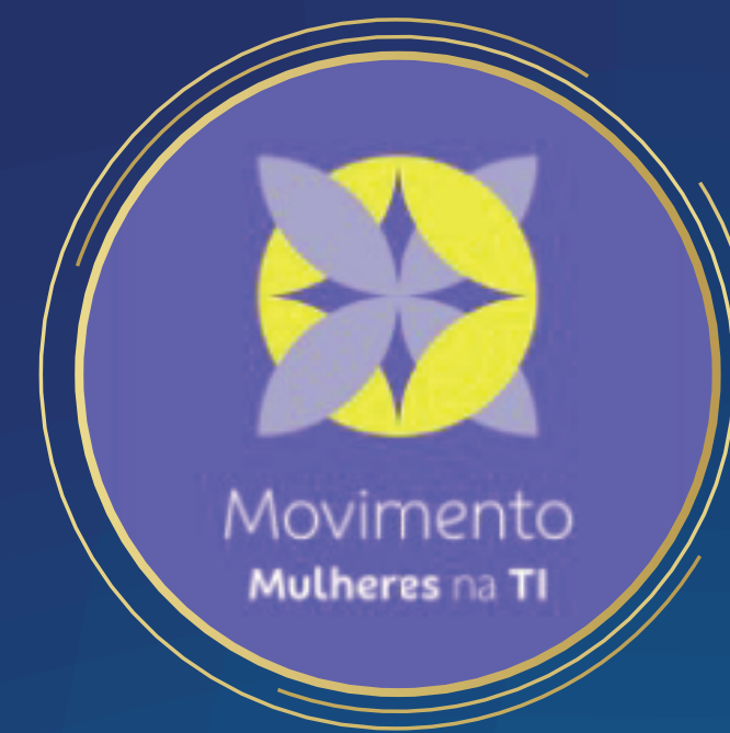
Movimento Mulheres na TI