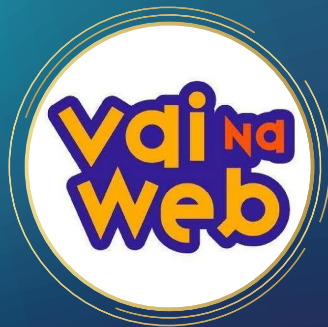
Vai na Web